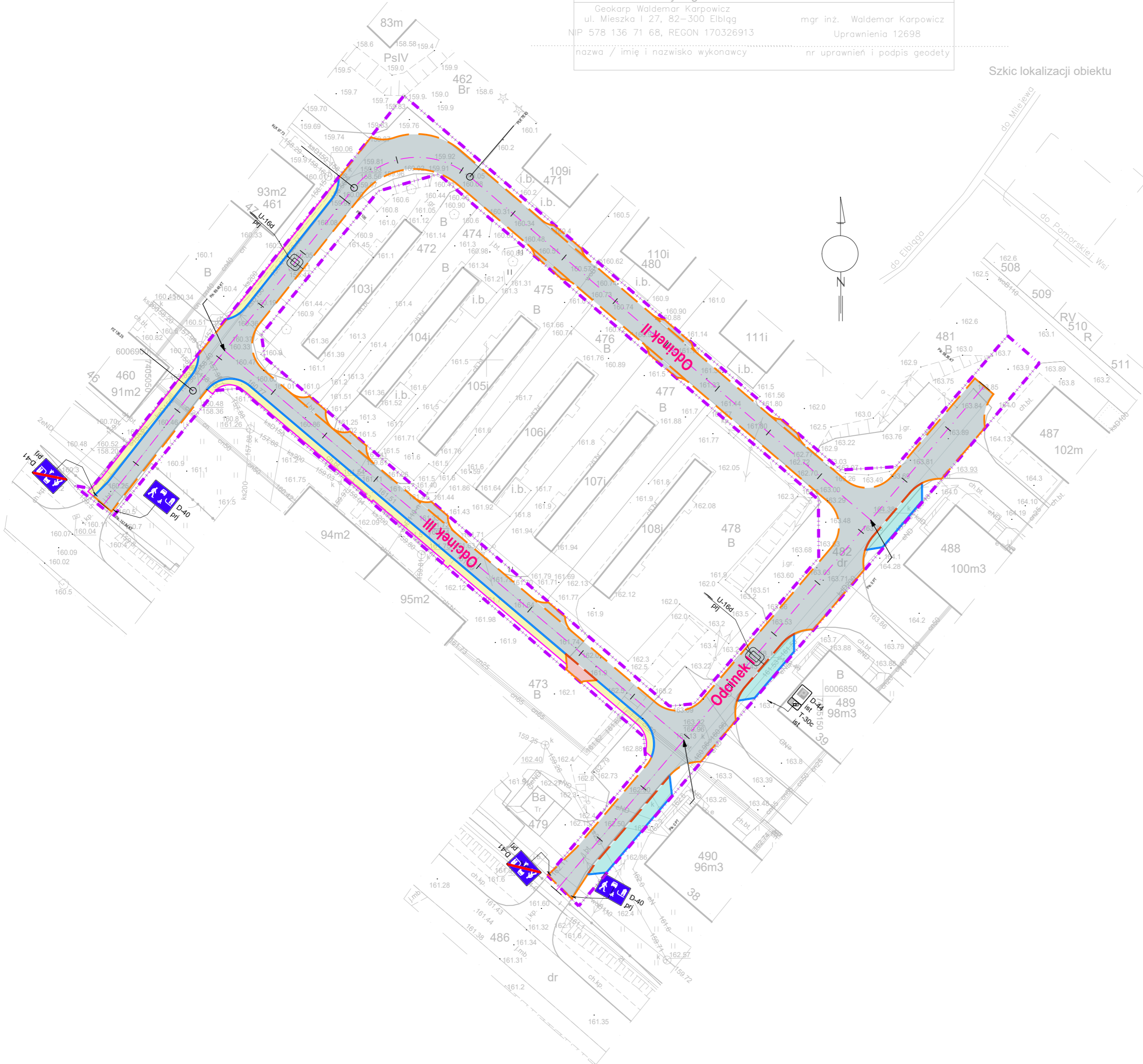
Szkic lokalizacji obiektu