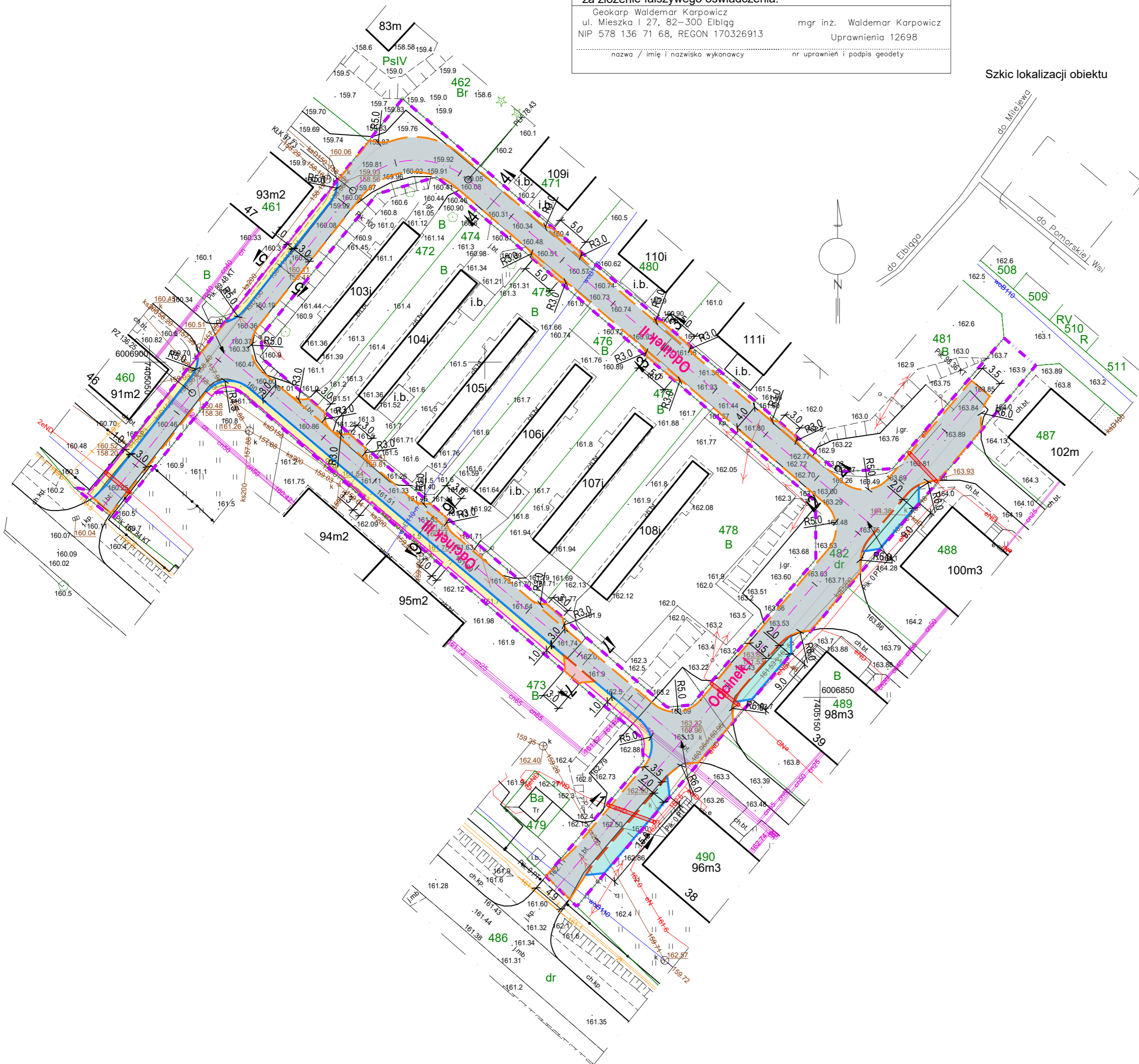
Szkic lokalizacji obiektu